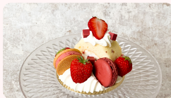
いちごパーティー