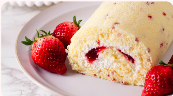
つぶつぶいちごロール