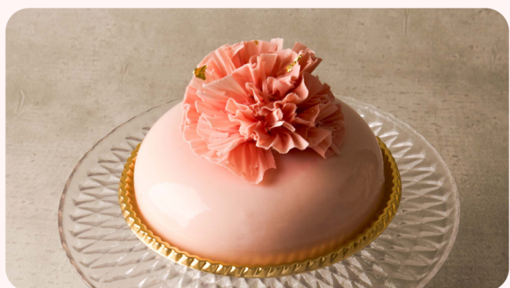
ペッシュ・ママン