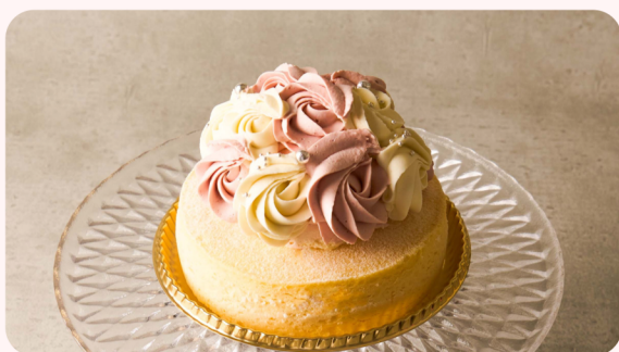
フルール・フロマージュ