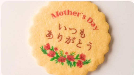
メッセージクッキー