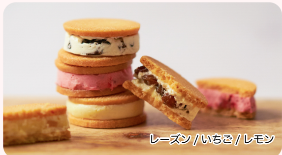
ガナッシュバターサンド